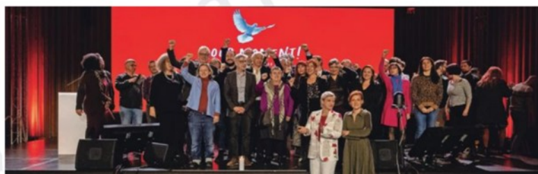
Za usodo Levice bo ključno, ali se bodo premiki zgodili vsaj pri gradnji stanovanj in ali bo predsednik vlade Robert Golob sprejel njihova izhodišča pokojninske reforme.