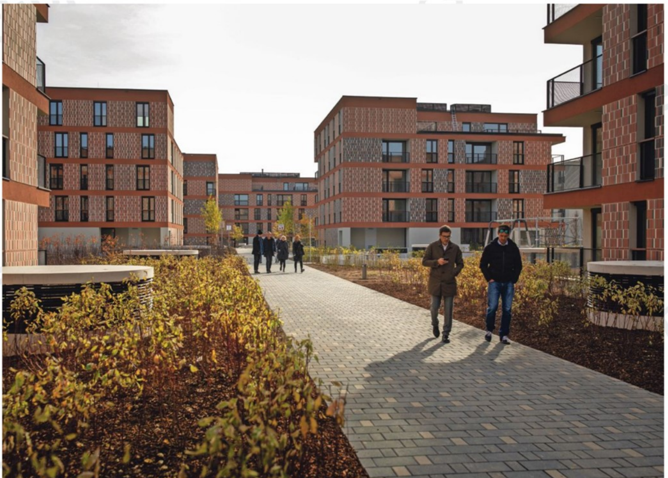
V praksi se dogaja, da v istem stanovanjskem bloku dva najemnika za enakovredno stanovanje plačujeta različno najemnino. Eno stanovanje je v lasti republiškega stanovanjskega sklada , drugo v lasti občinskega.